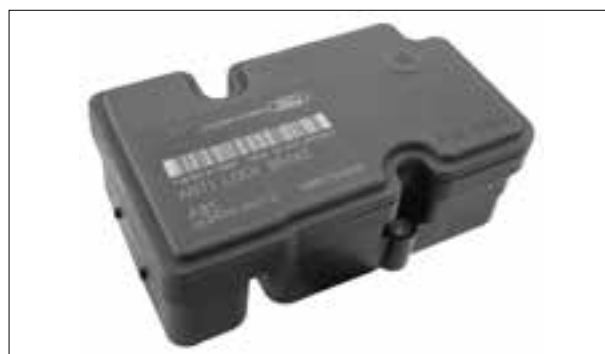
ATE MK70 - Défaut : « pas de communication »