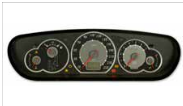
Affichage analogique défaillant (tachymètre et compte-tours)