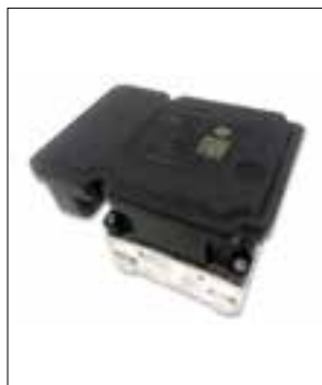
ATE MK61 de dessus