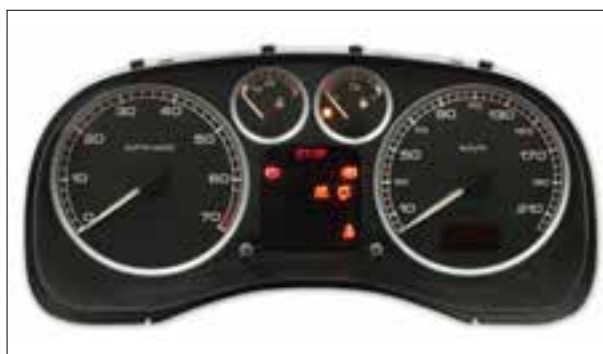
Affichage analogique défaillant