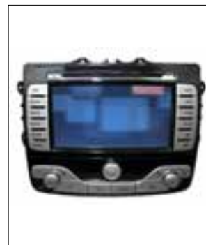
Travel Pilot NX