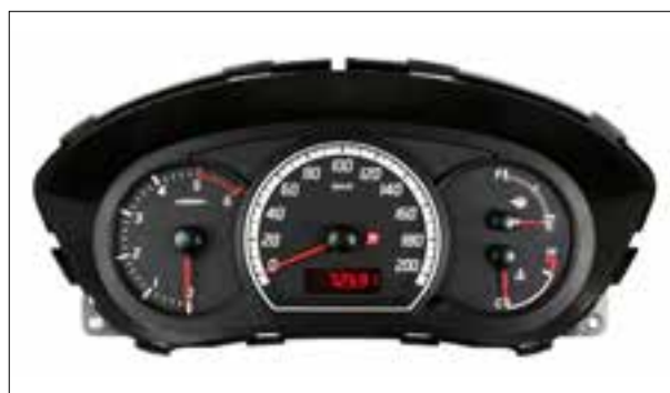
Panne du rétroéclairage