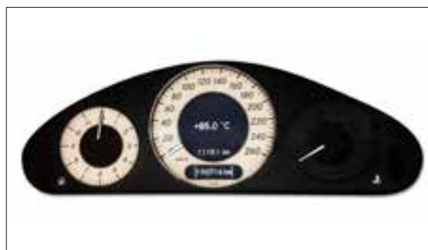
Panne du rétroéclairage

> Panne totale ou dysfonctionnement divers