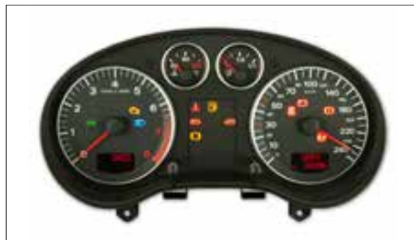
Panne totale aléatoire ou dysfonctionnements

> L'afficheur affiche « DEF » et le totalisateur indique « 0 »