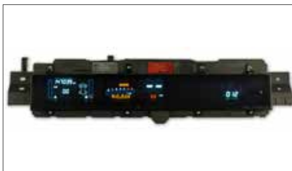
Panne totale aléatoire ou dysfonctionnements