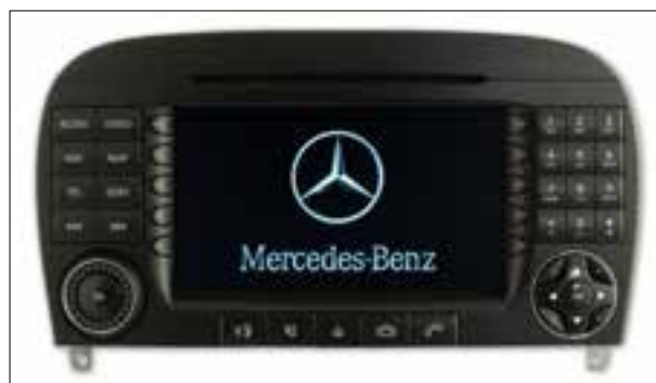
Défauts d'écran ou pannes d'écran

> Défauts d'écran ou pannes d'écran > Panne totale