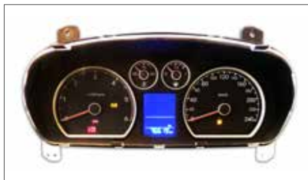
Panne du rétroéclairage