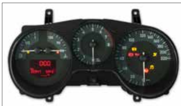
Panne totale aléatoire ou dysfonctionnements