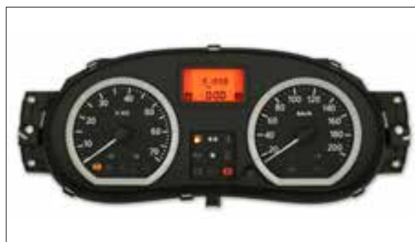
Affichage analogique défaillant