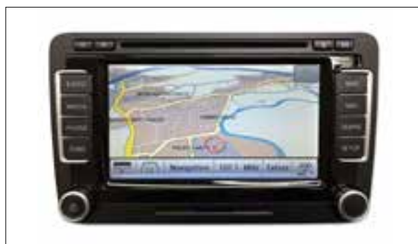
Défauts d'écran ou pannes d'écran