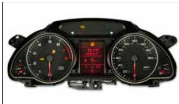
Défauts d'écran ou pannes d'écran