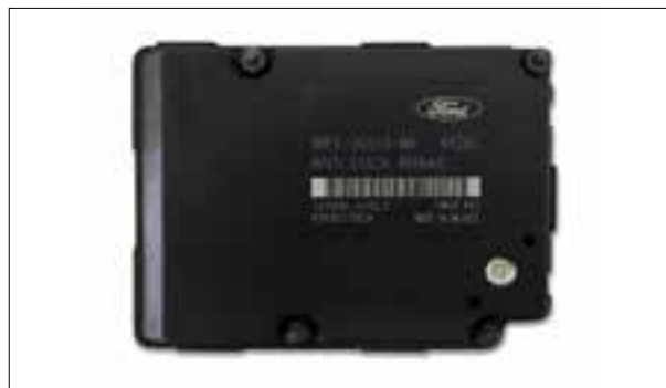
ATE MK20 - Défauts divers