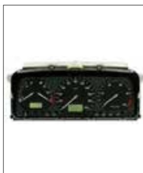
Affichage analogique défaillant (température du moteur et niveau de carburant)