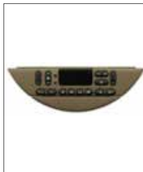
Défaut de pixels ou de segments

> Défaut de pixels ou de segments, affichage qui s'estompe