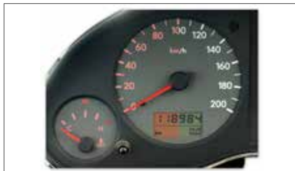
Panne du rétroéclairage