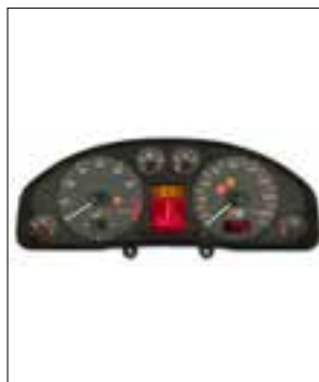
Défaut de pixels ou de segments