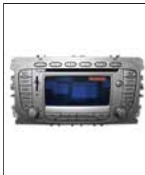
Travel Pilot FX