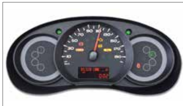
Affichage erroné de la vitesse