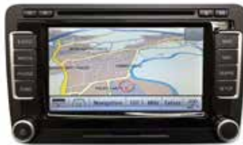
Défauts d'écran ou pannes d'écran