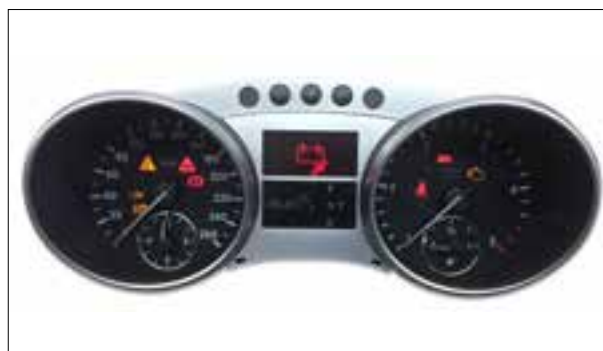
Défaut de pixels ou de segments, affichage qui s'estompe