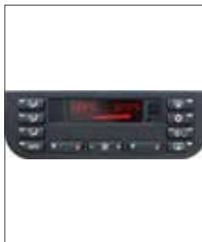
Panne totale aléatoire et touches qui ne fonctionnent pas

> Panne totale aléatoire et touches qui ne fonctionnent pas