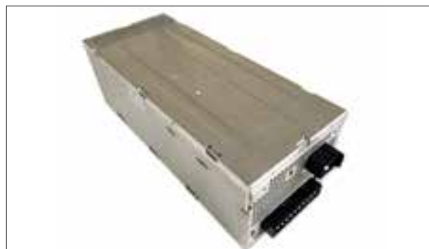
Dysfonctionnements divers des haut-parleurs (par ex. défaillance ou sifflement)

> Dysfonctionnements divers des haut-parleurs (par ex. défaillance ou sifflement)