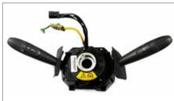
Dysfonctionnements divers (par ex. clignotants, klaxon ou feux de croisement)

> Dysfonctionnements divers (par ex. clignotants, klaxon ou feux de croisement)