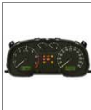
Affichage analogique défaillant