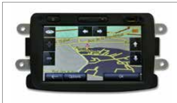
Panne totale aléatoire, Boot-Loop