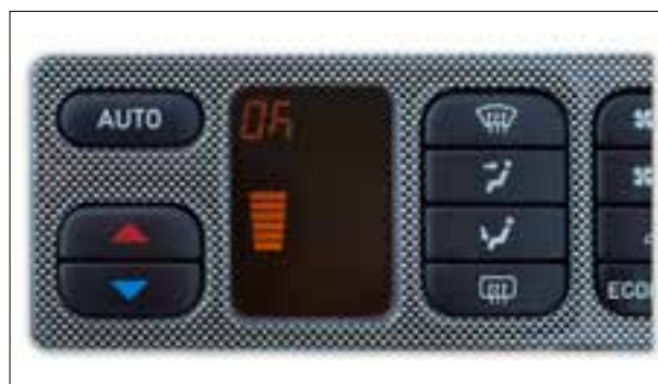
Défaut de pixels ou de segments