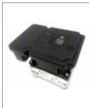
ATE MK61 de dessus

> Défaut moteur de pompe ou pompe hydraulique - le descriptif du défaut varie suivant l'outil de diag