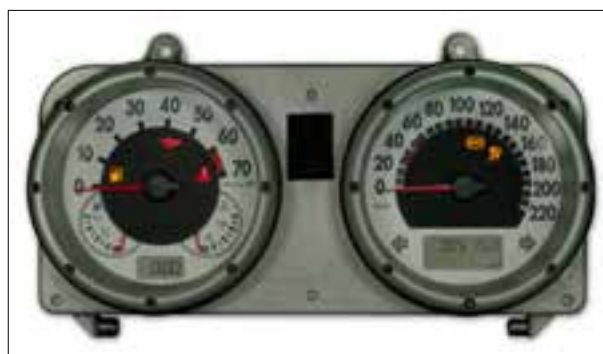
Affichage analogique défaillant