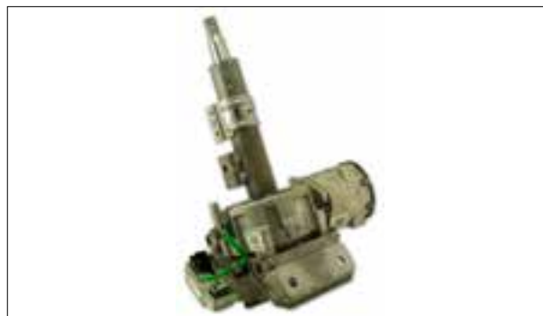
Panne aléatoire ou permanente de la direction assistée électrique