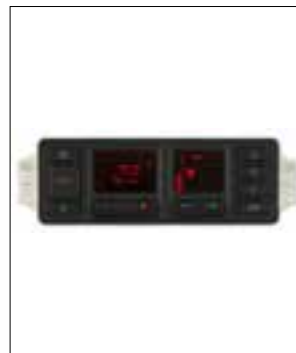
Panneau de commande climatisation