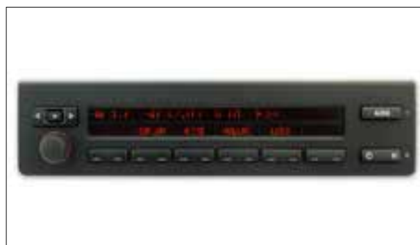
Défaut de pixels ou de segments

> Dysfonctionnements divers des haut-parleurs (par ex. défaillance ou sifflement)