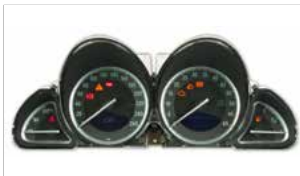
Affichage analogique défaillant

> COMAND APS NTG 2.5 - Défauts d'écran ou pannes d'écran