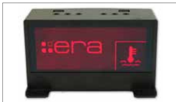
Défaut de pixels ou de segments, affichage qui s'estompe