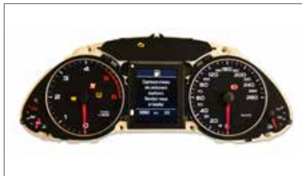
Défauts d'écran ou pannes d'écran