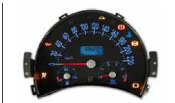
Panne totale aléatoire ou dysfonctionnements