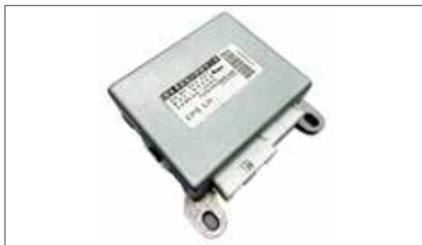
Panne aléatoire ou permanente de la direction assistée électrique

> Défauts divers, par ex. codes défaut C1552 + C1554