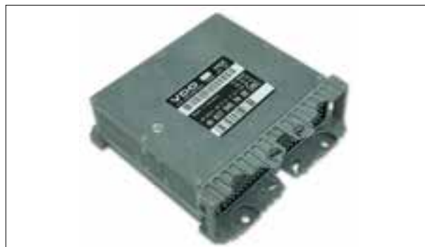
Défauts d'allumage sur deux ou trois cylindres

> Le totalisateur de kilomètres ne fonctionne plus