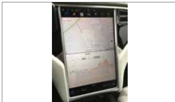
Défauts d'écran ou pannes d'écran