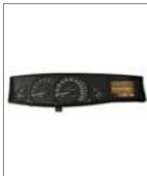
Affichage analogique défaillant