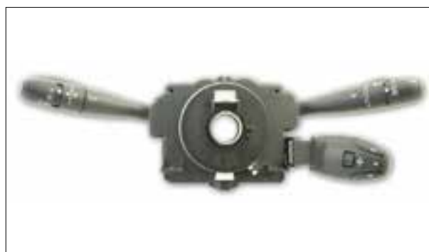
Dysfonctionnements divers (par ex. le clignotant ne fonctionne plus)