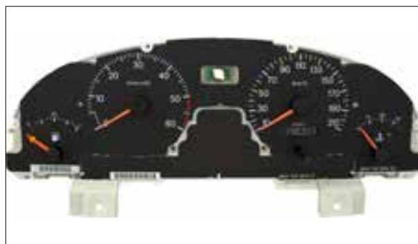
Affichage analogique défaillant