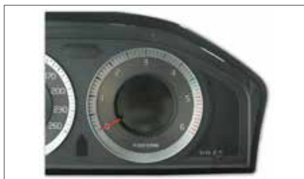
Panne du buzzer ou du haut-parleur