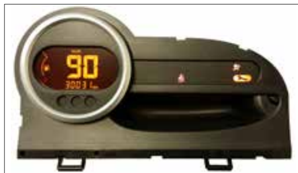
Un ou plusieurs voyants de contrôle restent allumés faiblement après coupure du contact