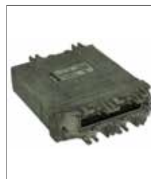
Le véhicule perd de la puissance ou le moteur tourne de façon irrégulière