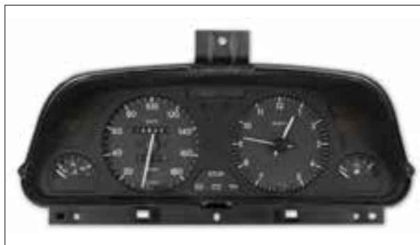
Affichage analogique défaillant

> Réglage de la température hors fonction (reste sur chaud ou sur froid) - Le volet de réglage est intact