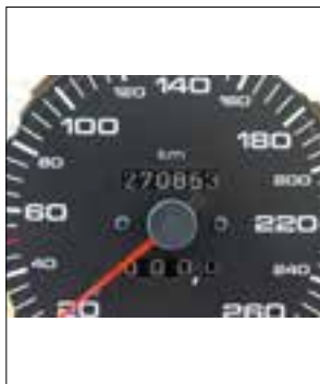
Le totalisateur de kilomètres ne fonctionne plus