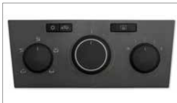
Boutons de réglage en panne

> Boutons de réglage en panne - Réglage de la température impossible