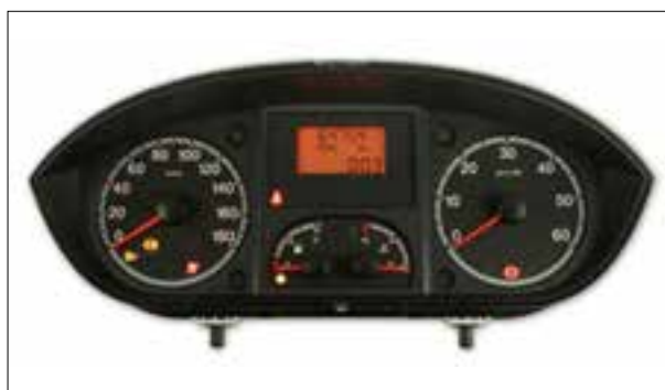
Affichage analogique défaillant

> Panne intermittente ou dysfonctionnements