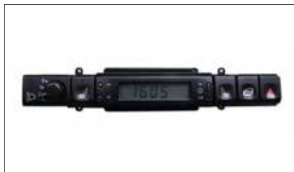
Défaut de pixels ou de segments, affichage qui s'estompe

> Défaut de pixels ou de segments, affichage qui s'estompe