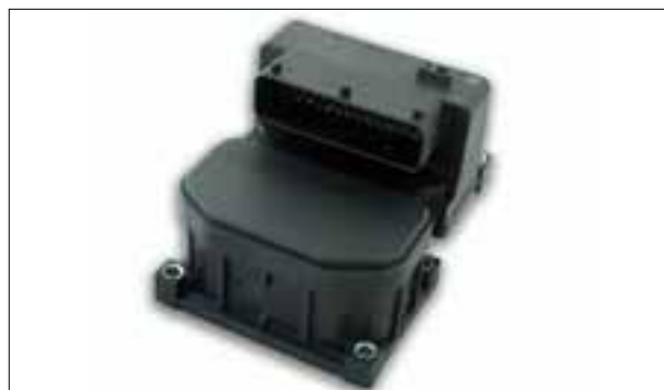
BOSCH 5.3/5.7 - Défauts divers