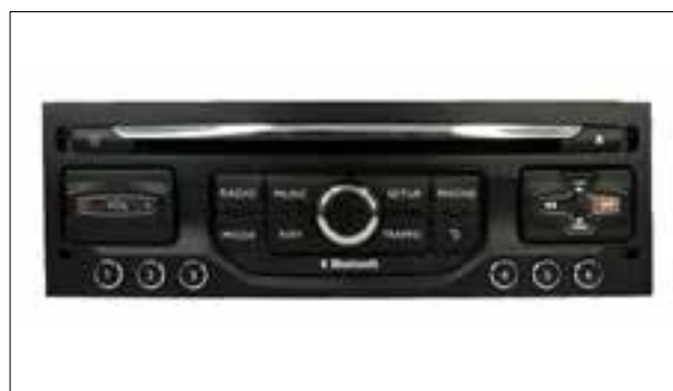
Panne totale ou redémarrage en boucle (reboot / bootloop)

> Panne totale ou redémarrage en boucle (reboot / bootloop)