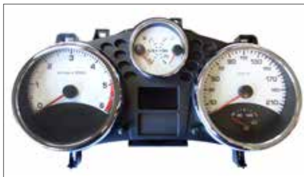
Panne totale aléatoire ou dysfonctionnements

> Panne totale ou redémarrage en boucle (reboot / bootloop)