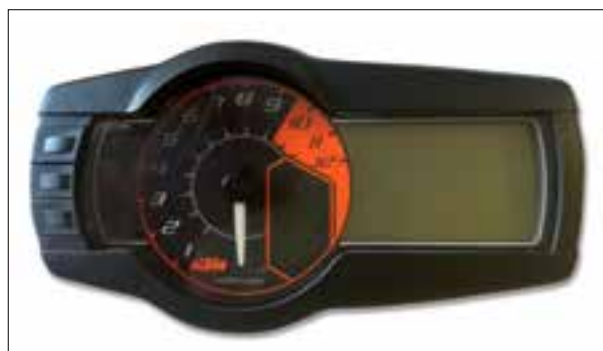
Panne totale aléatoire ou dysfonctionnements

> Panne intermittente ou dysfonctionnements