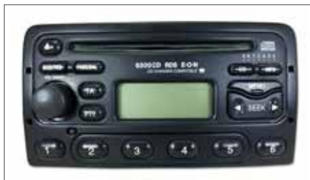
Réception FM en panne