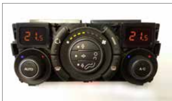
Défaut de pixels ou de segments