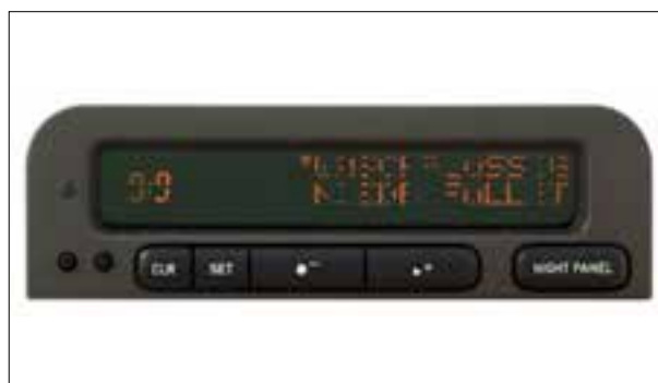
Défaut de pixels ou de segments

> Défaut de pixels ou de segments, affichage qui s'estompe > Panne du buzzer ou du haut-parleur