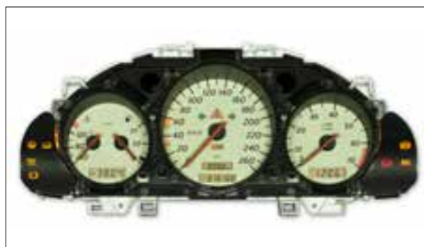
Affichage analogique défaillant

> Défauts divers, par ex. : 0705, 0717, 0718, 2767 et 2768