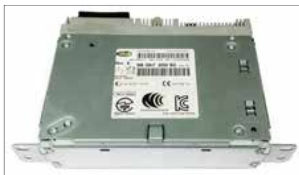
Panne totale ou redémarrage en boucle (reboot / bootloop)