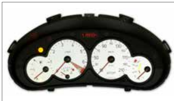
Affichage analogique défaillant