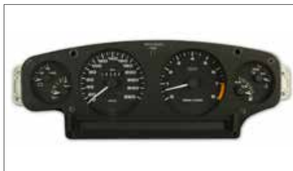
Affichage analogique défaillant