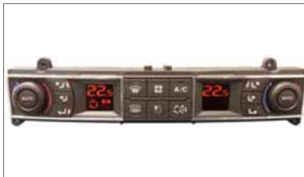
Boutons de réglage en panne