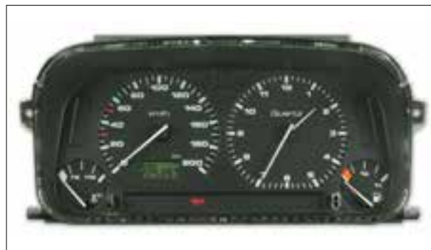
Affichage analogique défaillant