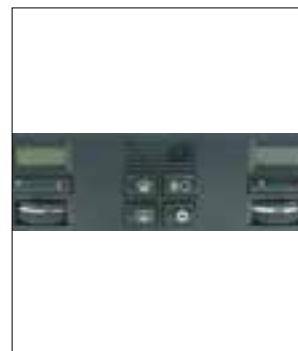
Panneau de commande climatisation