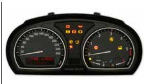
Panne du buzzer ou du haut-parleur

> Dysfonctionnements divers des haut-parleurs (par ex. défaillance ou sifflement)