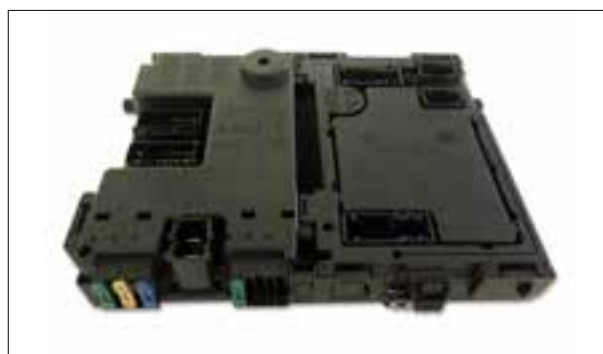
Dysfonctionnement du compresseur de climatisation