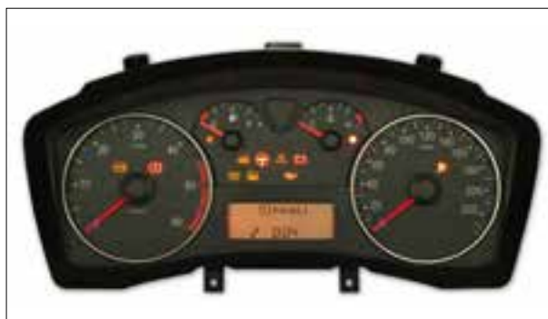
Panne totale aléatoire ou dysfonctionnements

> Panne intermittente ou dysfonctionnements