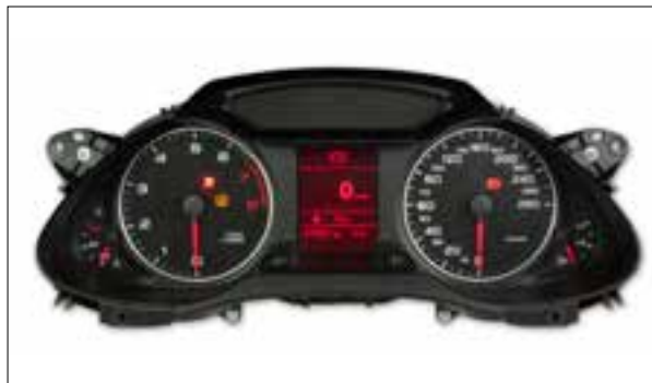
Défauts d'écran ou pannes d'écran