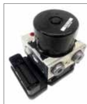
ATE MK61 de dessous