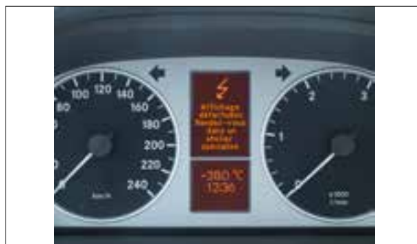
Défaut de pixels ou de segments