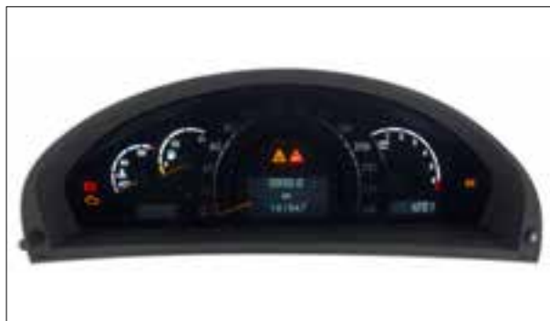
Panne du rétroéclairage

> Défauts de lecture du CD/DVD ou impossibilité de l'insérer/l'éjecter