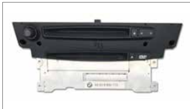
Coupures aléatoires, Boot-Loop - Prévoir un délai plus long

Pour les pannes courantes, notre délai d'intervention est inférieur à 4 jours ouvrés, transport inclus.