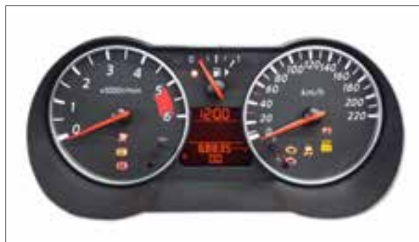
Panne totale intermittente ou dysfonctionnements