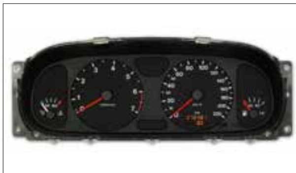
Panne totale aléatoire ou dysfonctionnements

> Panne totale aléatoire ou dysfonctionnements