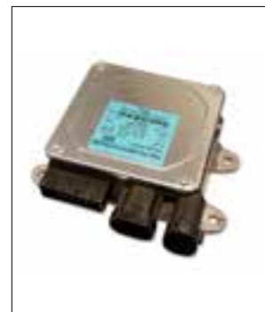
Panne aléatoire ou permanente de la direction assistée électrique