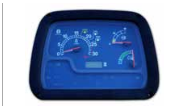
Compte-tours hors fonction et temps d'utilisation qui ne s'incrémente plus

> Compte-tours hors fonction et temps d'utilisation qui ne s'incrémente plus