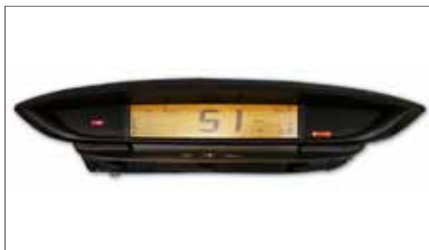
Défaut de pixels ou de segments, affichage qui s'estompe

&gt; Panne totale ou redémarrage en boucle (reboot / bootloop)