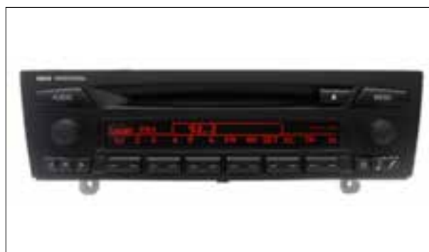
Défaut de pixels ou de segments