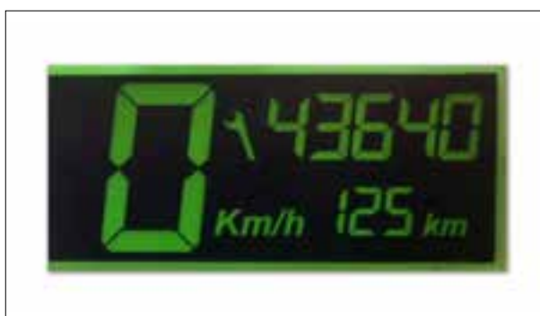
Défaut de pixels ou de segments

> Défaut de pixels ou de segments, affichage qui s'estompe