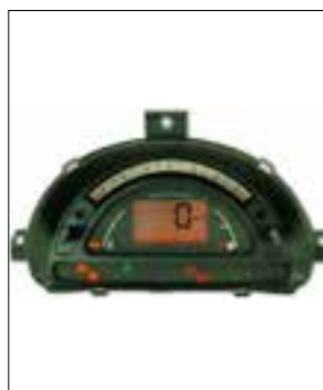
Panne totale aléatoire ou dysfonctionnements