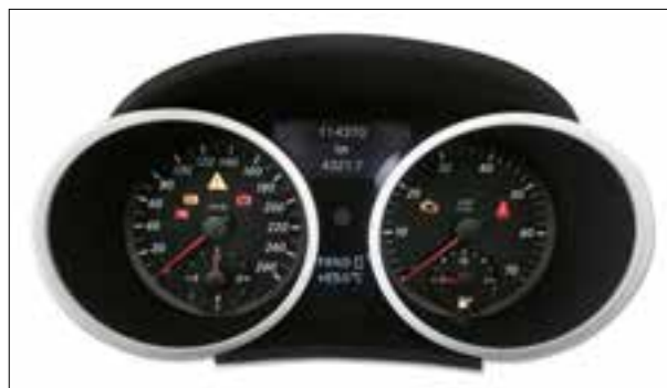
Défaut de pixels ou de segments

> Défaut de pixels ou de segments, affichage qui s'estompe