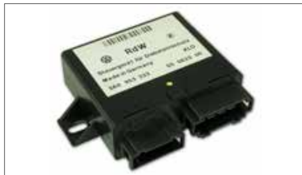
L'antidémarrage ne se débloquent pas et le véhicule ne démarre pas