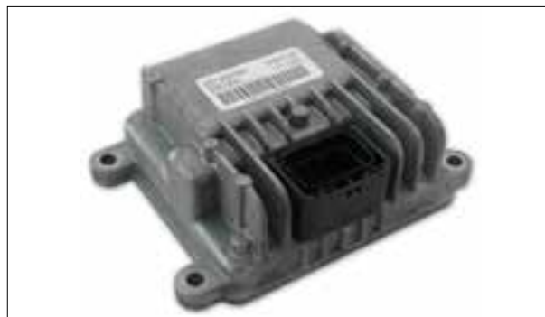
Dysfonctionnements divers (par ex. le véhicule s'arrête)

> Dysfonctionnements divers (par ex. le véhicule s'arrête)