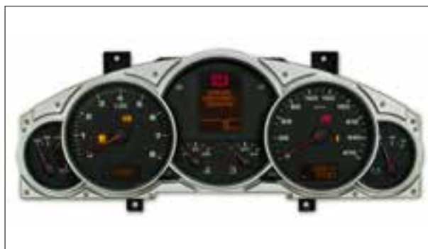
Défauts d'écran ou pannes d'écran

DIVERS AVEC TOTALISATEUR KILOMETRIQUE ANALOGIQUE