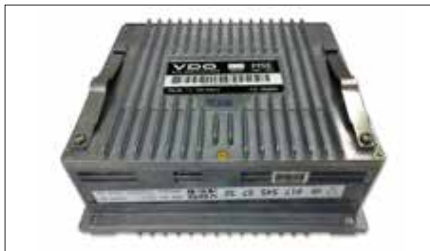
Défauts d'allumage sur trois cylindres

> Le totalisateur de kilomètres ne fonctionne plus