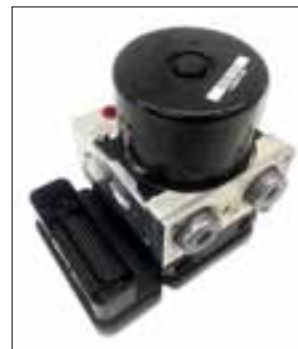
ATE MK61 de dessous