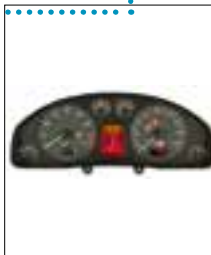
Défaut de pixels ou de segments