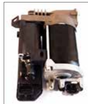
Pilotage de suspension arrière hors fonction