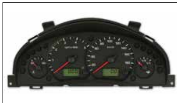
Panne totale aléatoire ou dysfonctionnements