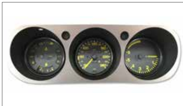
Le totalisateur de kilomètres ne fonctionne plus

> Le totalisateur de kilomètres ne fonctionne plus