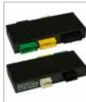
Verrouillage centralisé ou lève-vitres électriques en panne

Vous pouvez demander un enlèvement de pièce pour le jour même jusqu'à 14h30 dans la plupart des secteurs géographiques.