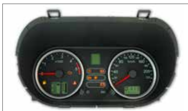
Panne totale aléatoire ou dysfonctionnements