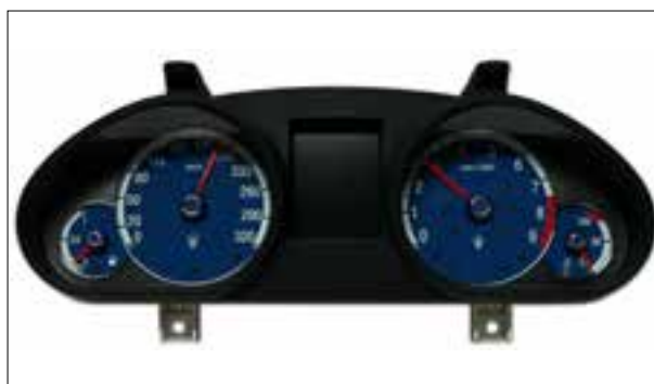
Défauts d'écran ou pannes d'écran