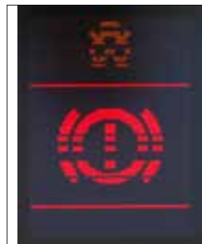
Défaut de pixels ou de segments