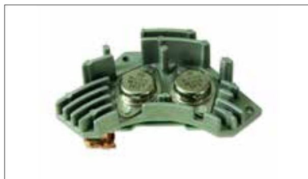
Impossibilité de régler la ventilation habitacle : elle ne fonctionne plus ou seulement sur puissance maximale