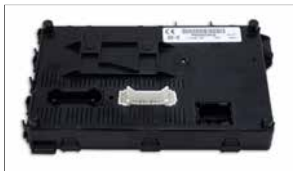
Exemple BSI | UCH