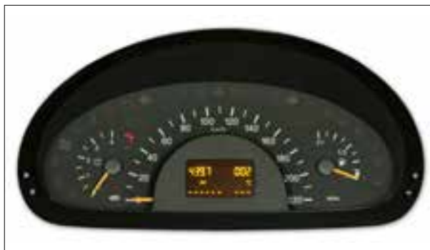
Défaut de pixels ou de segments

> Défaut de pixels ou de segments, affichage qui s'estompe