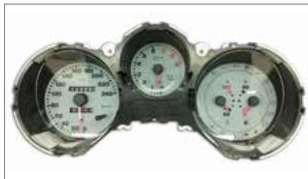
Le kilométrage total et journalier ne s'incrémentent plus ; le bouton TRIP ne fonctionne plus