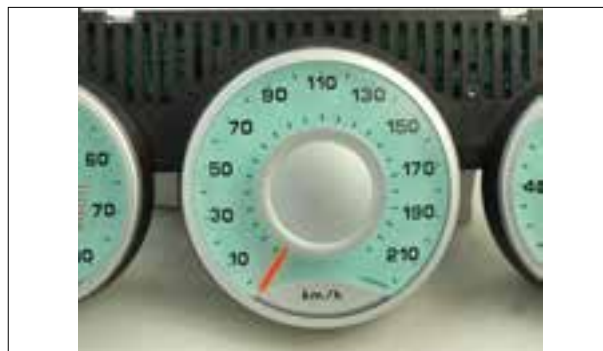
Affichage analogique défaillant