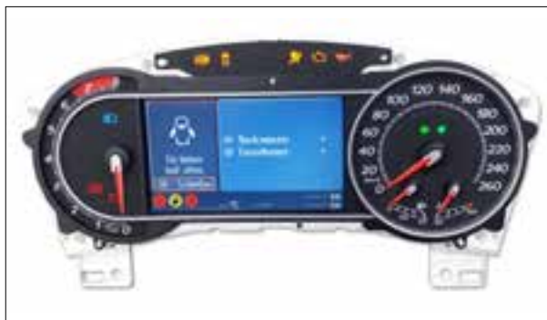
Panne totale aléatoire ou dysfonctionnements