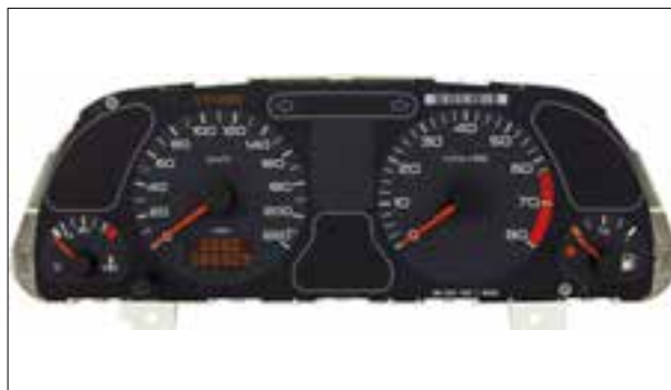
Affichage analogique défaillant

307 Berline/Break/SW/CC (3*) | de 04/2001 à 06/2005