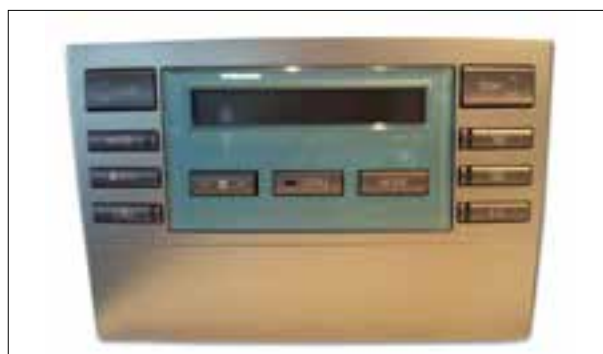
Réglage de la température hors fonction

> Réglage de la température hors fonction