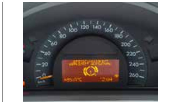
Défaut de pixels ou de segments