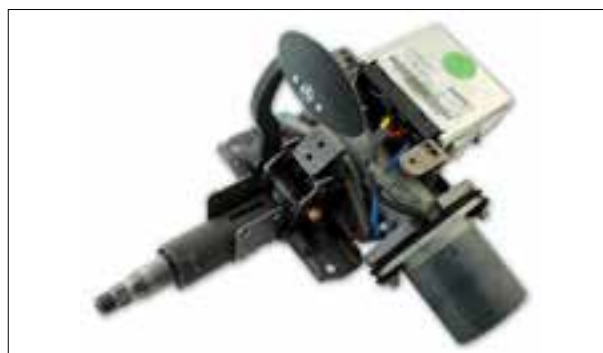
Panne aléatoire ou permanente de la direction assistée électrique