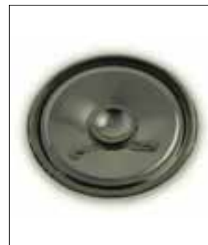
Panne du buzzer ou du haut-parleur