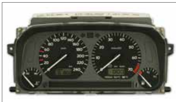
Panne totale aléatoire ou dysfonctionnements

> Défaut de pixels ou de segments, affichage qui s'estompe