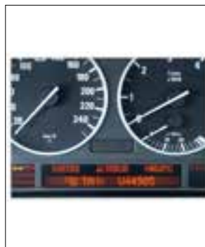
Défaut de pixels ou de segments