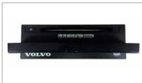
Défaut de lecture du CD/DVD