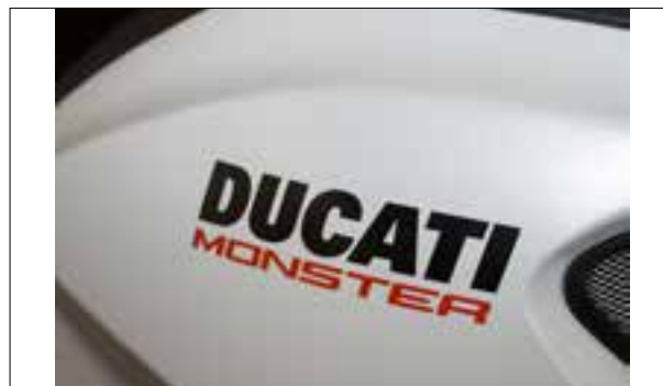
Affichage analogique défaillant (tachymètre et compte-tours)