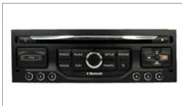
Panne totale ou redémarrage en boucle (reboot / bootloop)

> Panne totale ou redémarrage en boucle (reboot / bootloop)