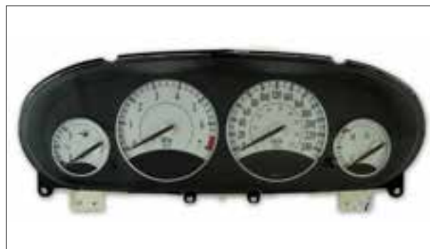
Panne du rétroéclairage