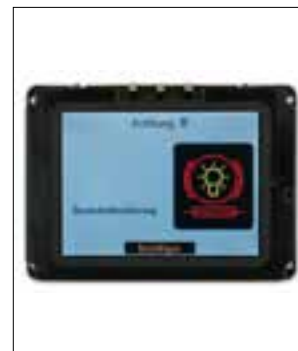
Défauts d'écran ou pannes d'écran