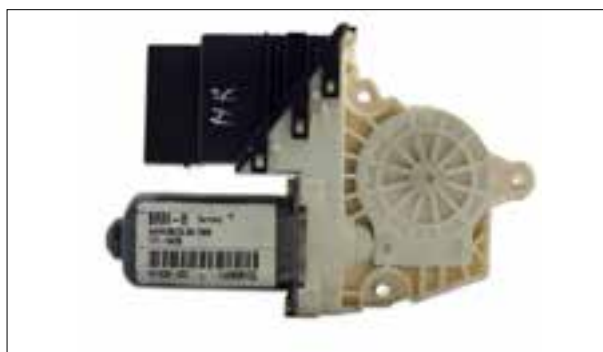
Panne aléatoire des lève-vitres électriques