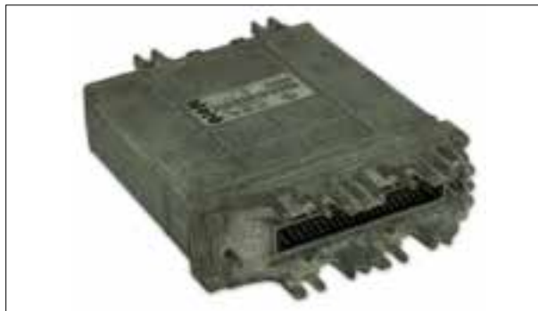
Calculateur moteur avec capteur de pression de tubulure d'admission intégré : perte de puissance ou fonctionnement chaotique du moteur