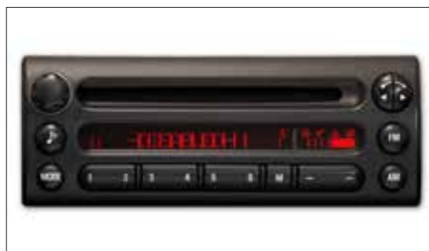
Défaut de pixels ou de segments

> Défaut : capteur de pression de freinage défectueux ; le descriptif du défaut varie suivant l'outil de diag