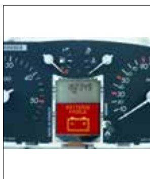
Message « batterie faible »