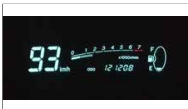
Afficheur digital en panne

> Défaut : capteur de pression de freinage défectueux ; le descriptif du défaut varie suivant l'outil de diag