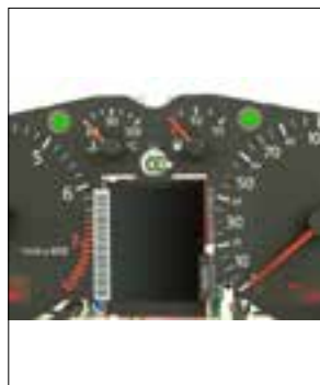
Témoins des clignotants en panne