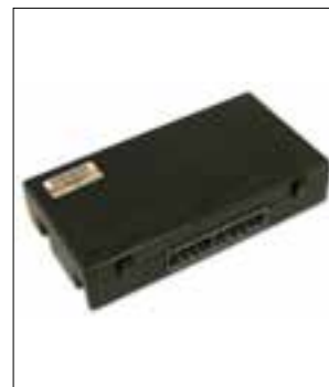
Réglage de la température hors fonction