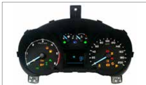
Panne du rétroéclairage