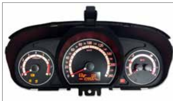
Panne totale aléatoire ou dysfonctionnements

> Panne intermittente ou dysfonctionnements