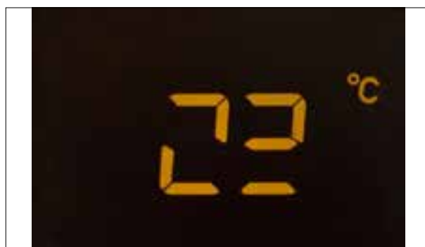
Défaut de pixels ou de segments

> Panne totale aléatoire et touches qui ne fonctionnent pas > Défaut de pixels ou de segments, affichage qui s'estompe