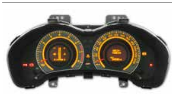
Témoins des clignotants en panne