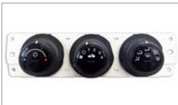
Panne du rétroéclairage