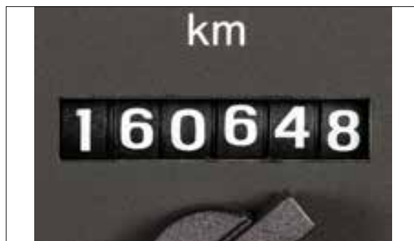
Le totalisateur de kilomètres ne fonctionne plus