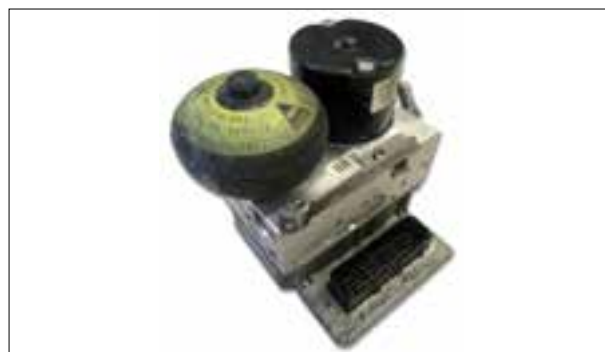
Seuil de service atteint (par ex. codes défaut C235A ou C249F)

> Panne totale ou dysfonctionnement divers