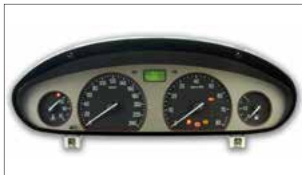
Panne de l'éclairage extérieur du véhicule