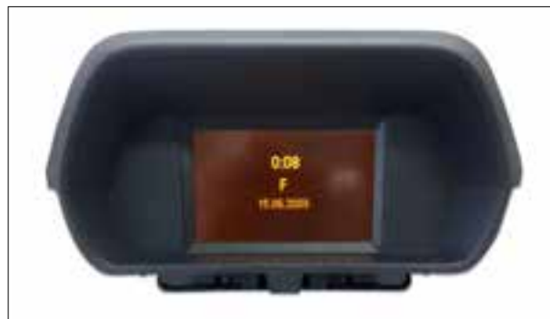
Défaut de pixels ou de segments, affichage qui s'estompe