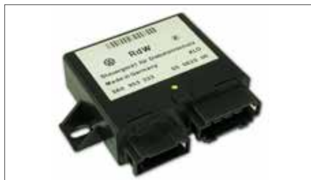
L'antidémarrage ne se débloque pas et le véhicule ne démarre pas