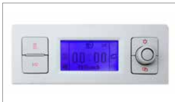
Défaut de pixels ou de segments, affichage qui s'estompe

> Dysfonctionnements divers (par ex. le système ne démarre pas, absence de son, écran blanc)