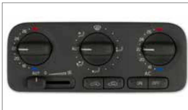
Boutons de réglage en panne