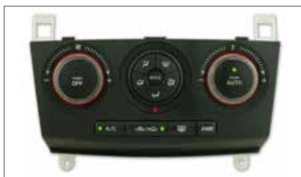
Boutons de réglage en panne - Plus de possibilité de régler la température