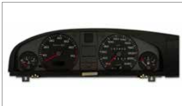
Le totalisateur de kilomètres ne fonctionne plus