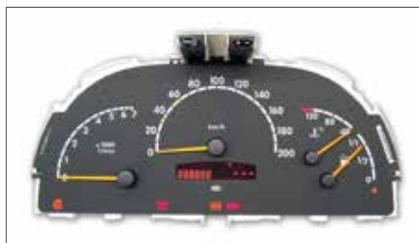
Panne totale aléatoire ou dysfonctionnements

> Panne intermittente, dysfonctionnements ET défaut de pixels