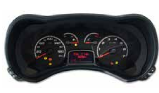
Un ou plusieurs voyants de contrôle restent allumés faiblement après coupure du contact