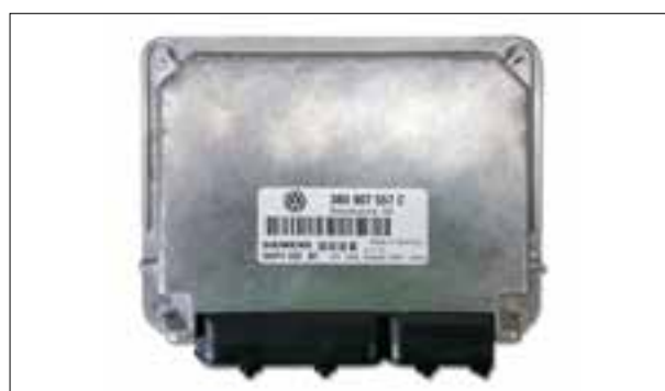
Commande d'au moins un injecteur défectueuse