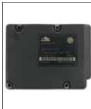
Défauts divers (par ex. pas de communication ou défaut « capteur de roue »)

> Panne d'un phare xénon (l'ampoule est intacte)