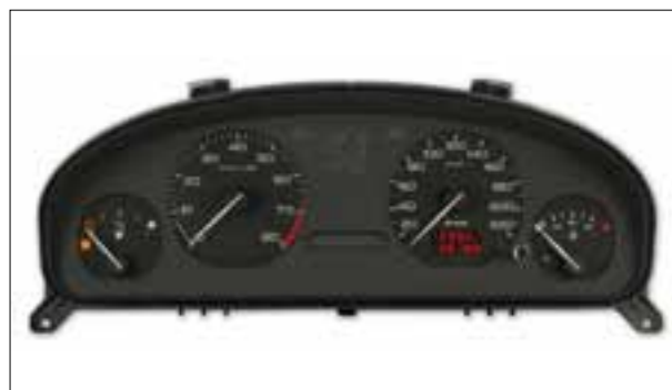
Affichage analogique défaillant

> Dysfonctionnements divers de la climatisation ou de la ventilation