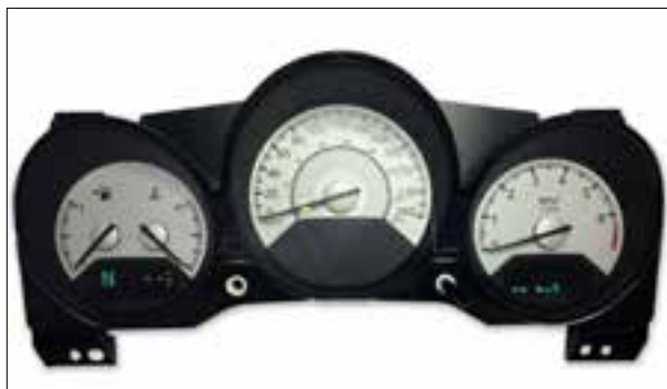
Panne du rétroéclairage

> Affichage analogique défaillant (tachymètre et compte-tours)