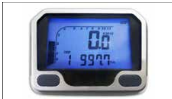
Panne totale aléatoire ou dysfonctionnements