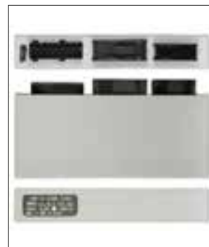
Verrouillage centralisé ou lève-vitres électriques en panne