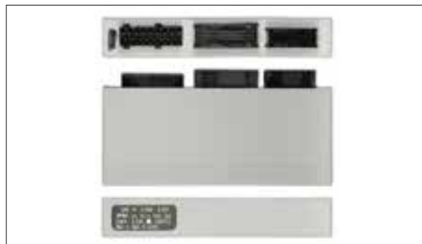
Verrouillage centralisé ou lève-vitres électriques en panne

> Dysfonctionnements divers des haut-parleurs (par ex. défaut-lance ou sifflement)