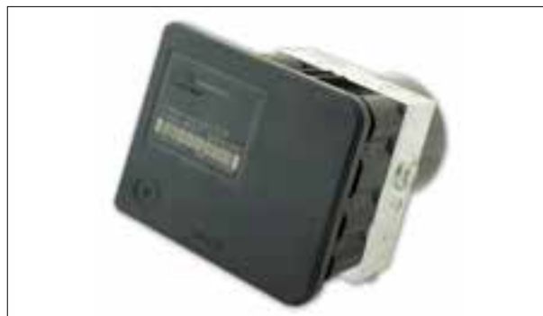
ATE MK60 - Défaut : « capteur de pression de freinage défectueux »