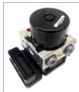
ATE MK61 de dessous