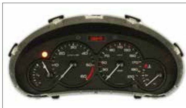
Affichage analogique défaillant