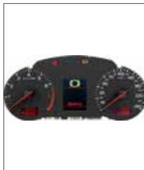
Défaut de pixels ou de segments