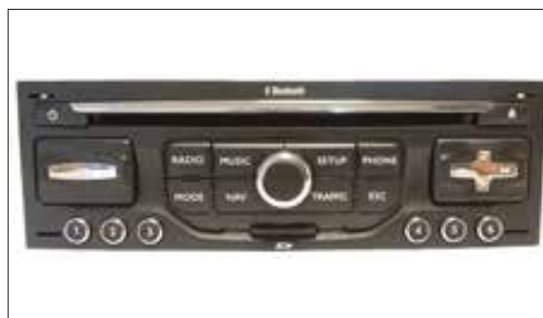
Panne totale ou redémarrage en boucle (reboot / bootloop)

> Panne totale ou redémarrage en boucle (reboot / bootloop)