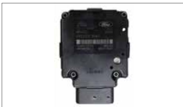
Défauts divers (par ex. moteur de pompe défectueux ou défaut relais de valve)