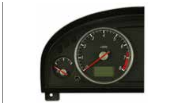
Panne totale aléatoire ou dysfonctionnements

> Appareil hors fonction à froid, dysfonctionnements divers