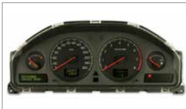
Panne totale aléatoire ou dysfonctionnements