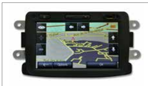
Panne totale aléatoire, Boot-Loop