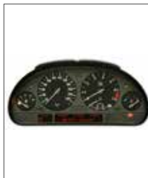
Défaut de pixels ou de segments

> Défaut de pixels ou de segments, affichage qui s'estompe