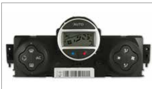
Défaut de pixels ou de segments