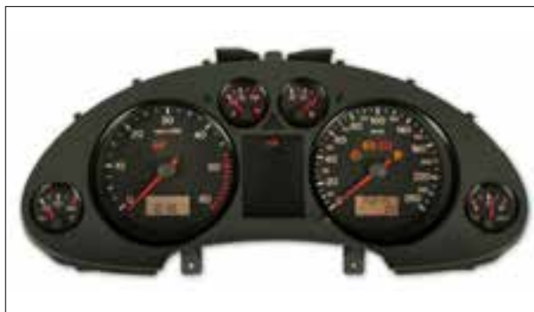
Panne totale aléatoire ou dysfonctionnements