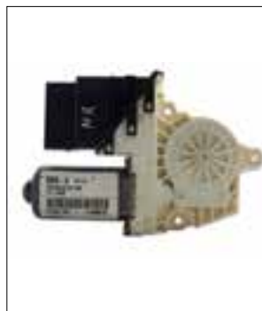
Panne aléatoire des lève-vitres électriques

> Panne aléatoire des lève-vitres électriques