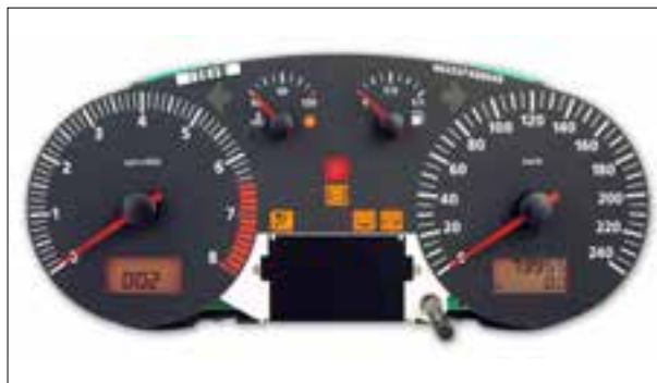
Panne totale aléatoire ou dysfonctionnements