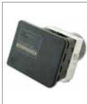
Défaut : capteur de pression de freinage défectueux

> Dysfonctionnements divers (par ex. le système ne démarre pas, absence de son, écran blanc)