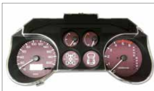
Affichage analogique défaillant