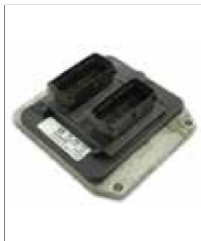
SIEMENS SIMTEC 70