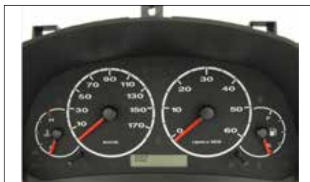
Affichage analogique défaillant