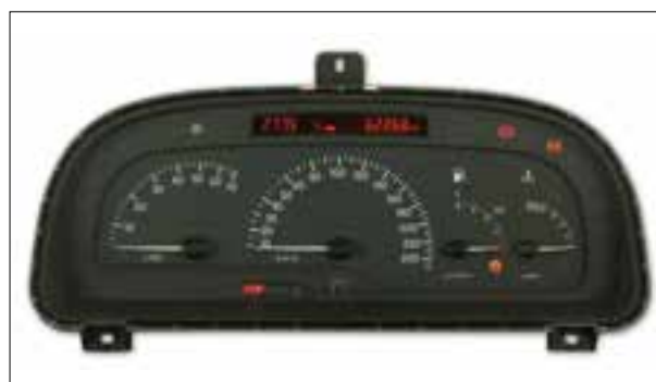
Affichage analogique défaillant