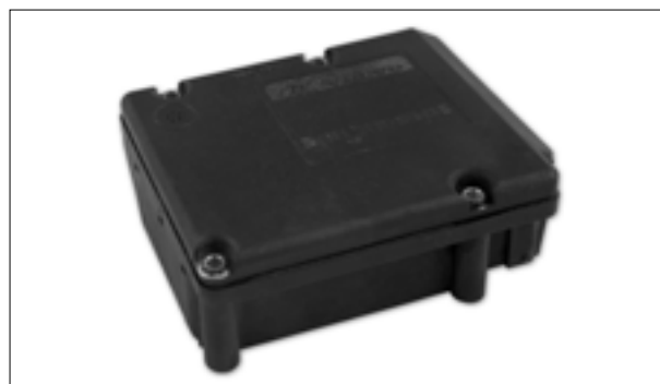
Défauts divers (par ex. pas de communication)

> Défaut moteur de pompe ou pompe hydraulique - le descriptif du défaut varie suivant l'outil de diag