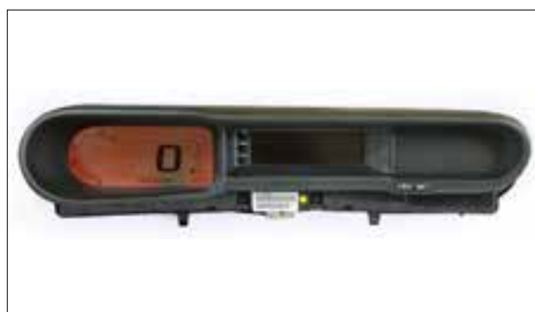
Panne du rétroéclairage