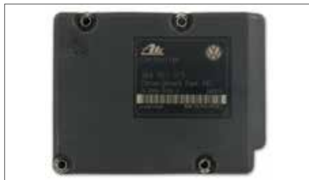
ATE MK20/MK25 - Défauts divers

> Défauts divers (par ex. défaut moteur de pompe défectueux ou relais de valve)