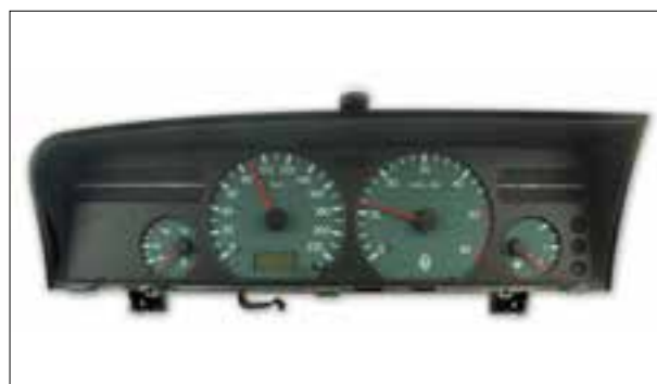
Affichage analogique défaillant (tachymètre et compte-tours)

> Impossibilité de régler la ventilation habitacle : elle ne fonctionne plus ou seulement sur puissance maximale