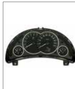
Dysfonctionnements divers (par ex. Défauts divers le véhicule s'arrête)