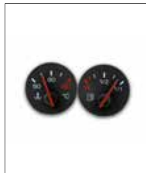
Affichage analogique défaillant (température du moteur et niveau de carburant)